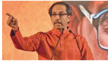
गैरफायदा घेऊन जर कोणी

मुंबई - देशाभिमानी हिंदू आहेत. आम्ही हिंदू भोळे आणि भाबडे नक्कीच आहोत, पण मूर्ख नाही. आपल्या याच हिंदुत्वाचा