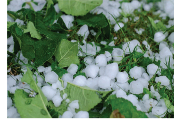
यांनी तहसिलदार यांचेकडे एका निवेदनाद्वारे केली आहे.