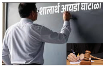
असून या प्रकरणाने विभागातील ५०० हून

(प्रतिनीधी वरुड दर्पण) नाशिक - नाशिक विभागातील बोगस शालार्थ आयडी घोटाळा प्रकरण राज्यात गाजत आहे. नाशिकरोड पोलीस ठाण्यात या संदर्भात गुन्हा दाखल