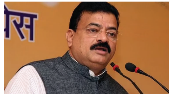
निश्चित करावी लागेल'. संघटनात्मक बदलांचीही त्यांनी सूचक शब्दांत गरज व्यक्त केली. दोन

आहे ते होणारच आहे. मात्र, हे दिवसही निघून जातील. त्यासाठी आता काही कार्यक्रम आरखावे लागतील, काही ठोस निर्णय घ्यावे लागतील आणि पक्षाची पुढील भूमिका