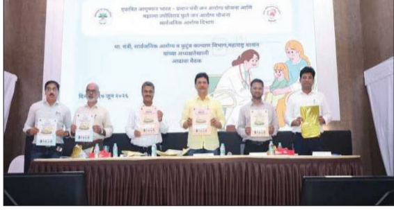
या योजनेनुसार उपचारासाठी रुग्णालयात