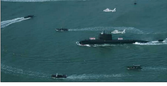
बंगालच्या खाडीत आपली तयारीत असून, त्यासाठी नौदल उपस्थिती वाढवण्याच्या चीनकडून मिळालेली

इस्लामाबाद - १९७१ च्या भारत-पाकिस्तान युद्धातील पराभवानंतर बंगालच्या खाडीतून जवळपास पूर्णपणे माघार घेतलेल्या पाकिस्तानने आता पुन्हा या रणनीतिकदृष्ट्या महत्त्वाच्या सागरी क्षेत्राकडे मोर्चा वळवला आहे. तब्बल ५५ वर्षांनंतर पाकिस्तान