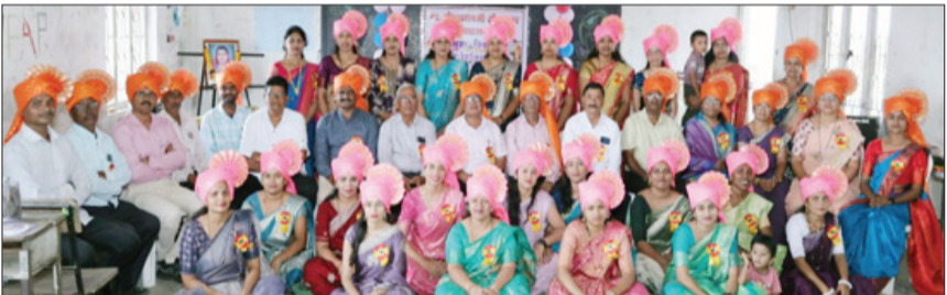
स्व.केशवरावजी क्षीरसागर जागृत विद्यालयात